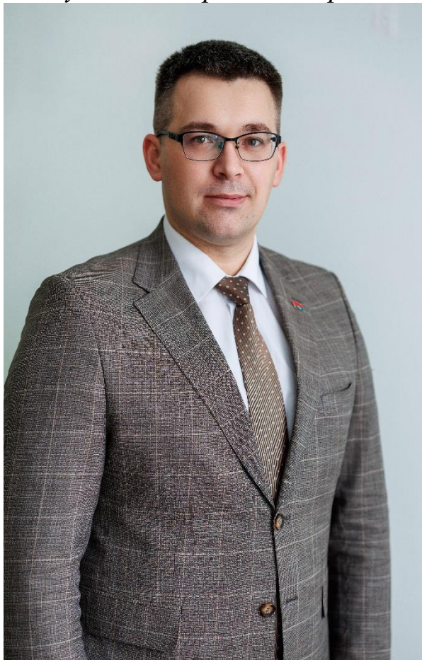
Климук Владимир Владимирович

Улицы: Тельмана с № 62 по № 84, Защитная, Фестивальная с № 2 по № 30, Поселковая, Грунтовая с № 3 по № 41 и с № 2 по № 58, Песчаная, Крестьянская, Дальняя, Переносная, Фроленкова с № 4 по № 24, Базисная с № 3 по № 9 и с № 16 по № 28, Першукевича с № 4 по № 18, Фроленкова №№ 2, 2-а, 2-б, 2/2, Восточный поселок, переулки: 1, 2, 3-й Переносные, 2-й Тельмана, 1-й Тельмана с № 4 по № 38, 1-й Поселковый, 1-й Грунтовый, 1,2,3-й Дальние, 1,2,3,4-й Крестьянские, 2-й Рабочий с № 2 по № 6, 1-й Рабочий с № 3 по № 6, 1-й Защитный, 1, 2, 3-й Водопроводные, 4-й Водопроводный с № 4 по № 8, 2-й Защитный, 1, 2, 3, 4, 5-й Артиллерийские.